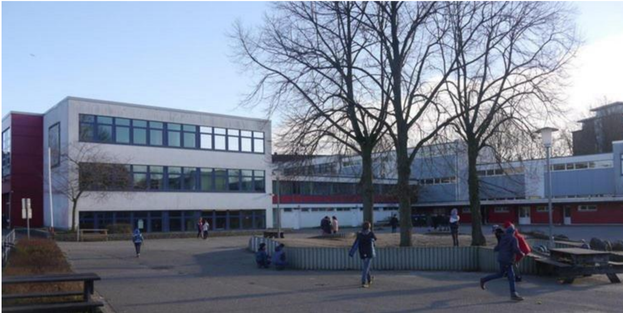
Die Gemeinschaftsschule Altenholz in der Danziger Straße 18c.